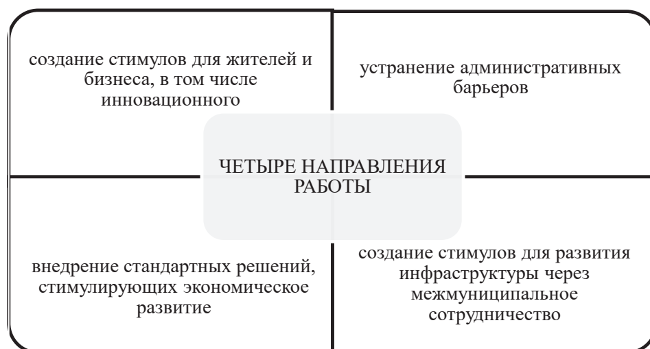
Рис. 2. Направления работ в развитии малых городов [8].

Создание благоприятной образовательной среды для подготовки квалифицированных кадров со средним и высшим образованием,